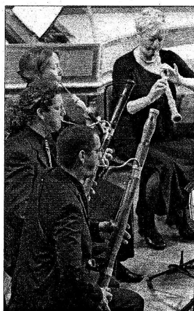
Fast dankbare Haltung zur Musik: das Freiburger Barockorchester.